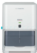
血液化学検査器 IDEXX カタリスト One 動物用管理医療機器 | 臨床化学分析装置