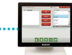
院内検査情報管理システム IDEXX ベットラボ ステーション