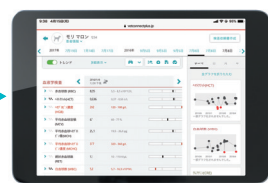
無償のクラウドシステム IDEXX ベットコネクト プラス