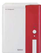
自動血球計算装置 IDEXX プロサイト Dx 動物用管理医療機器 | 血球計数装置