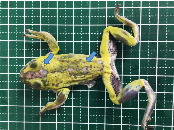
図 1. シュレーゲルアオガエル, ホルマリン固定後肉眼写真. 青矢印で示す多数の潰瘍が認められます。内臓には多発性の白色結節が見られました。